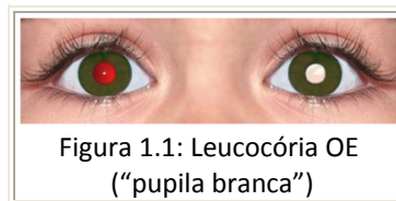
Figura 1.1: Leucocória OE (“pupila branca”)

É importante que, no início da escolaridade, a criança reúna as melhores condições visuais e esteja já adaptada à correcção óptica, se necessária. Aos 5 anos de idade é de esperar uma acuidade visual de 10/10, em ambos os olhos.